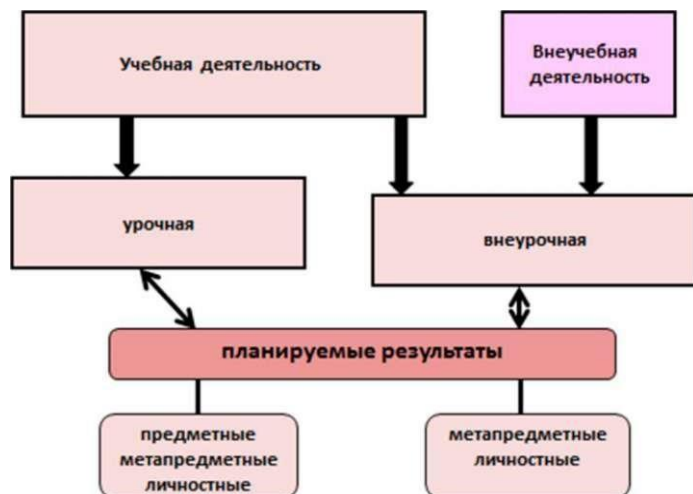
Рис. 1. Схема организации коррекционной работы в МОБУ СОШ с.Тазларово МР Зианчуринский район РБ

Коррекционная работа в обязательной части (70 %) реализуется в учебной урочной деятельности при освоении содержания образовательной программы. На каждом уроке учитель-предметник ставит и решает коррекционно-развивающие задачи. Содержание учебного материала отбирается и адаптируется с учетом особых образовательных потребностей обучающихся с ограниченными возможностями здоровья. Освоение учебного материала этими школьниками осуществляется с помощью специальных методов и приемов.